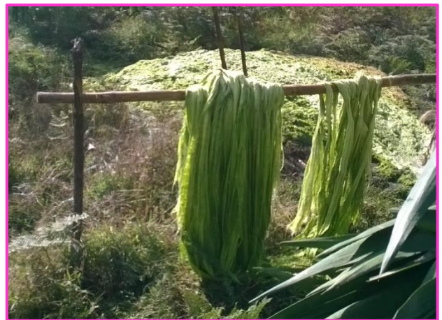
Imagen 48 Fuente propia de investigación.