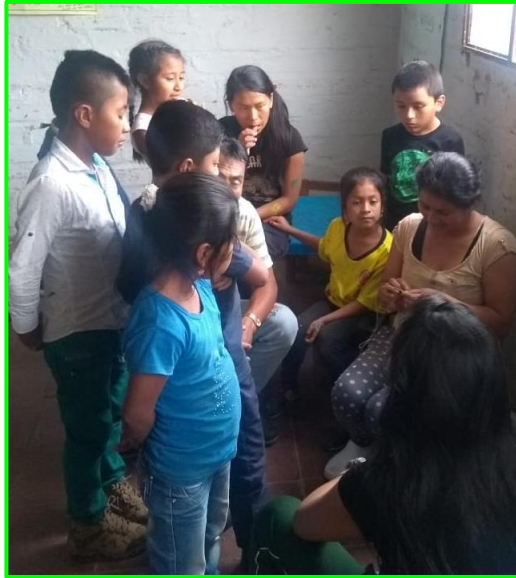
Imagen 19