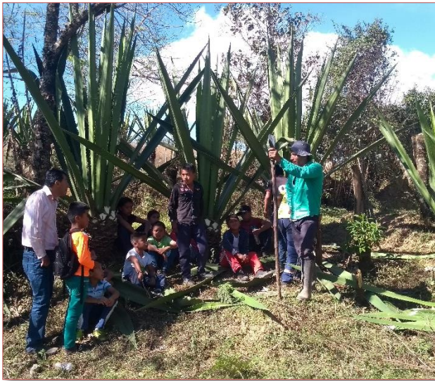
Imagen 37