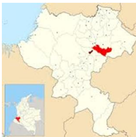
Figura 3 Mapa Municipio de Totoró 20

Totoró fue fundado en el año 1.815 y elevado a la categoría de Municipio en 1.835. En su devenir histórico se destacan algunas gestas importantes. Desde la pre conquista estuvo habitado por la etnia Páez en los territorios de Novirao, Paniquitá, Polindara y Jebalá. Igualmente, por las etnias Totoró y Polindara quienes mantenían relaciones culturales y económicas con grupos étnicos circunvecinos tales como los Kokonukos, Guambianos y Yanaconas, además de esporádicas relaciones con Chibchas e Incas 21 .