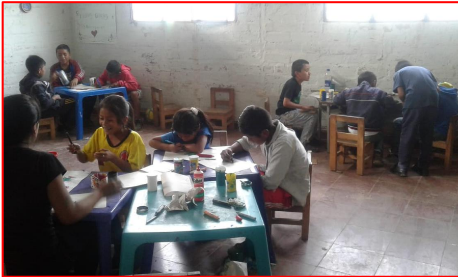
Imagen 25