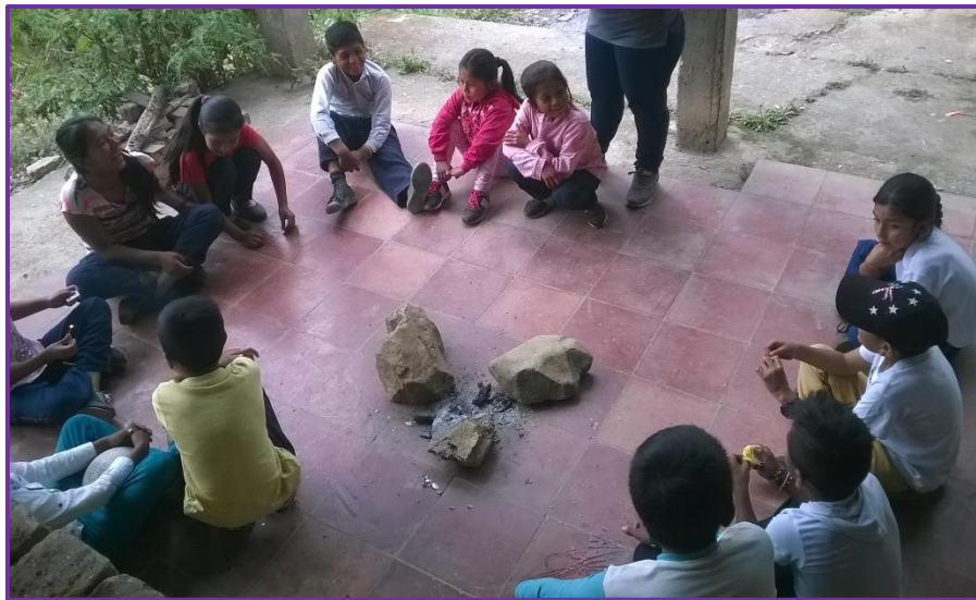
Imagen 8