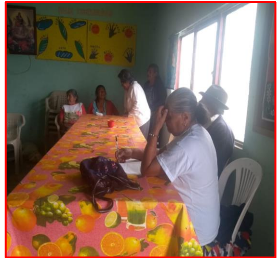
Imagen 7