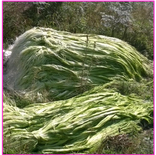
Imagen 26