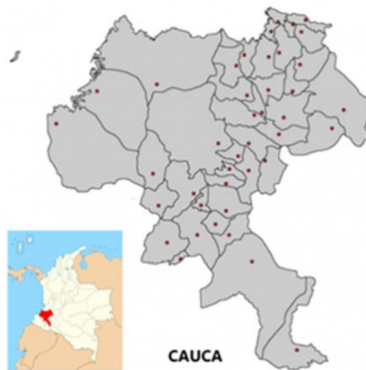
Figura 2 Mapa Departamento del Cauca 13

El Departamento de Cauca está situado en el suroeste del país entre las regiones Andina y Pacífica. Desde el punto de vista de su fisiografía, el departamento del Cauca incluye la llanura del Pacífico, caracterizada por ser baja, cubierta en general de bosque de mangle. La cordillera occidental de los Andes colombianos se extiende de suroeste a noreste del departamento, y corre paralela a la cordillera central, donde están localizados el volcán de Sotará, Petacas y el Nevado del