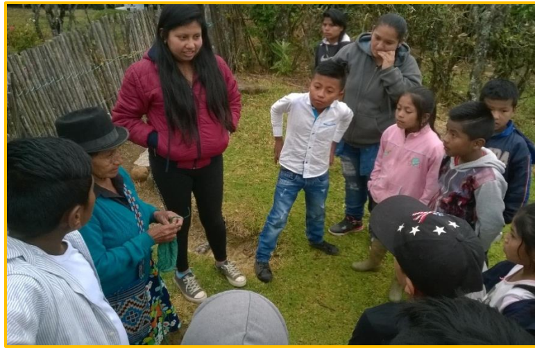
Imagen 14