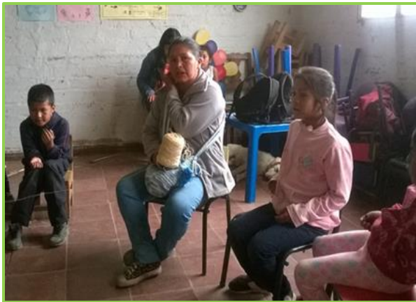
Imagen 9