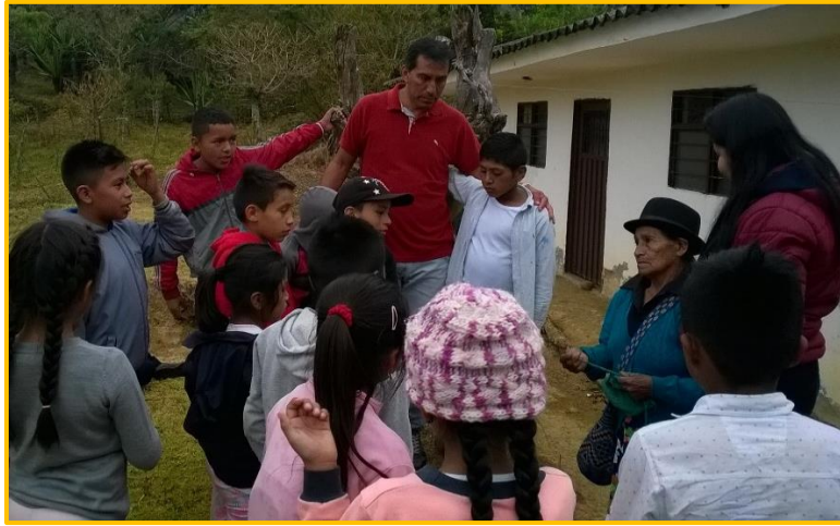
Imagen 13 Fuente propia de investigación.