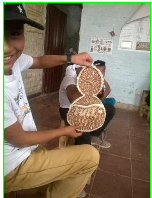
Imagen 22