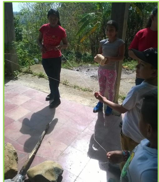
Imagen 10