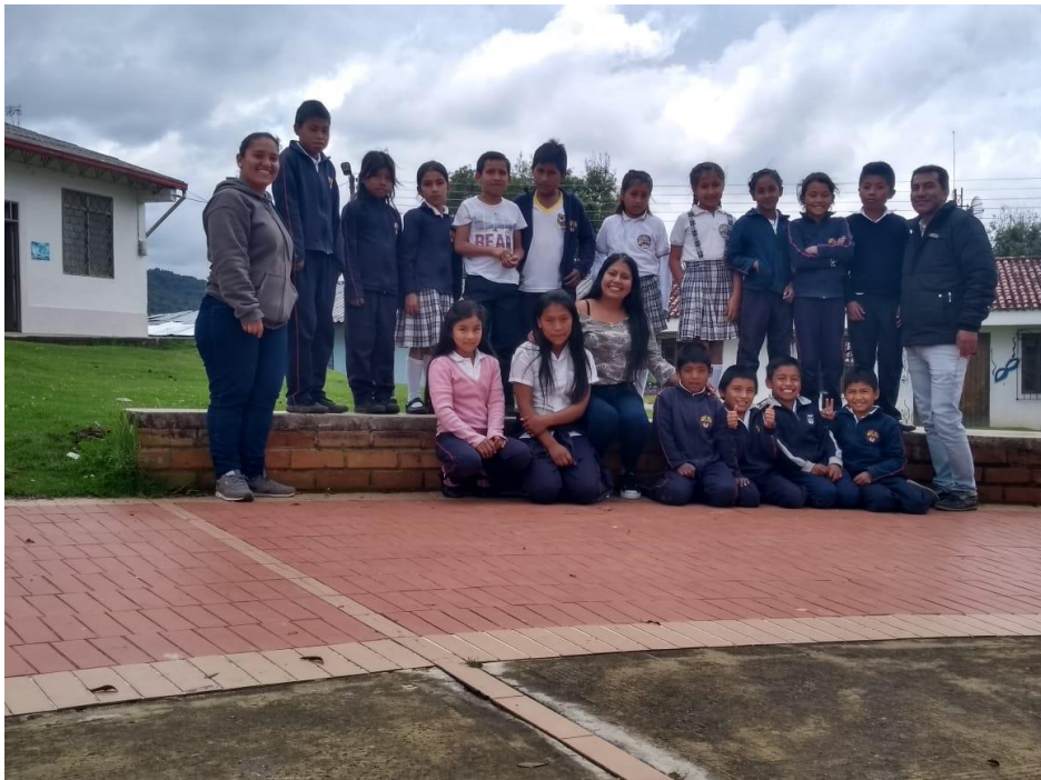
Imagen 29