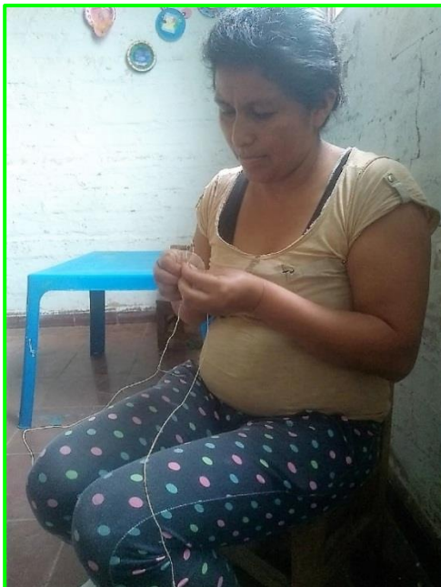
Imagen 21