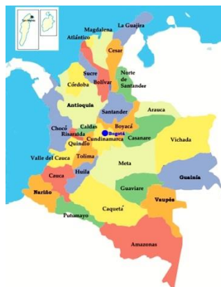
Figura 1 Mapa Político de Colombia 7

La República de Colombia se encuentra ubicada al noroccidente de América del Sur, gracias a su posición geográfica, Colombia