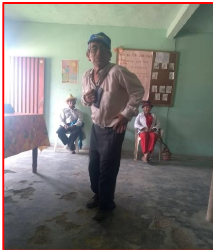
Imagen 6