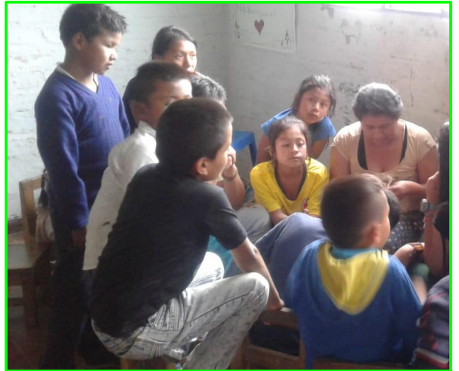
Imagen 20