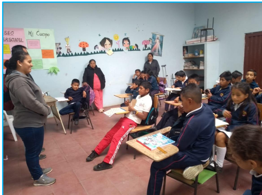
Imagen 27