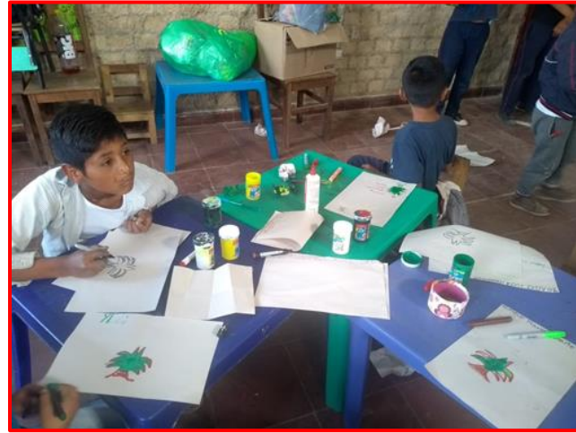
Imagen 23