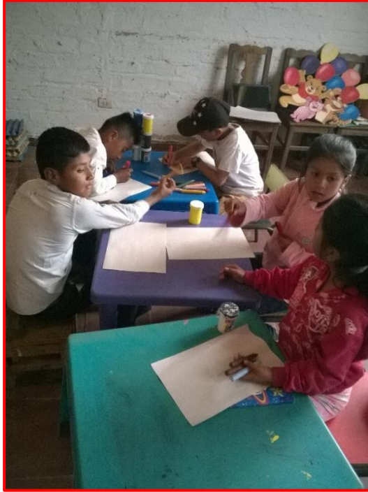
Imagen 24