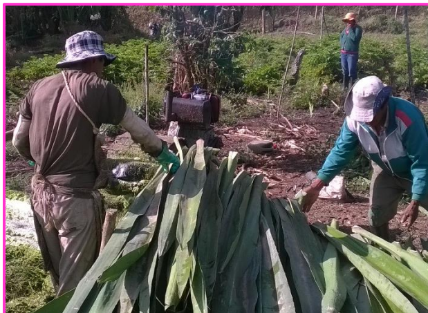
Imagen 15