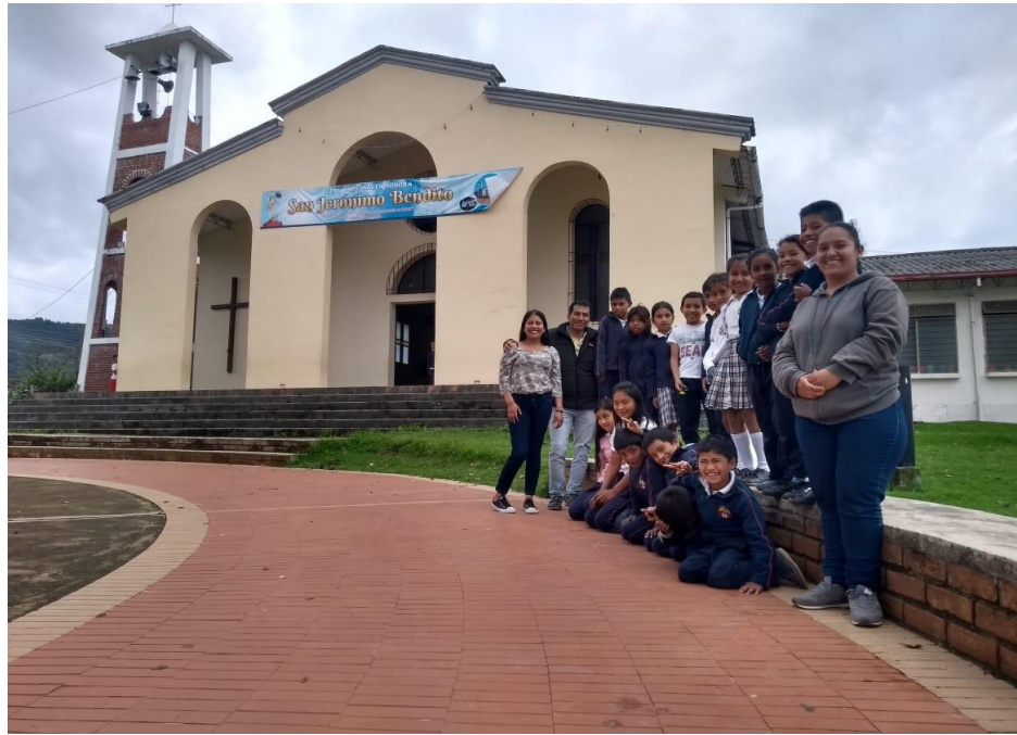
Imagen 28