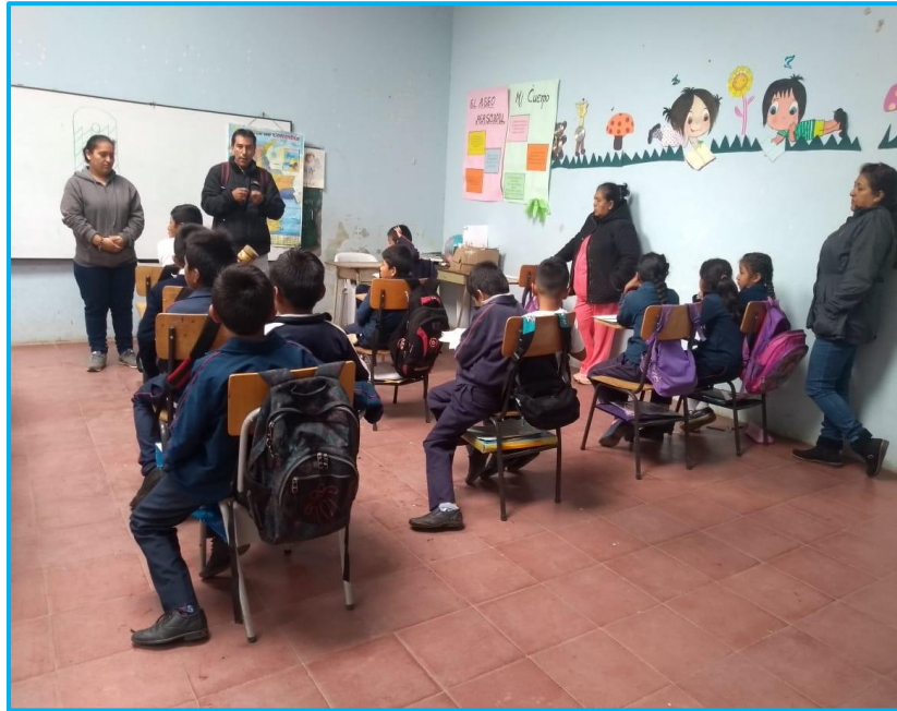
Imagen 26