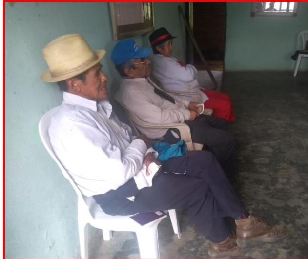
Imagen 5

Conversatorio con los mayores sabedores.