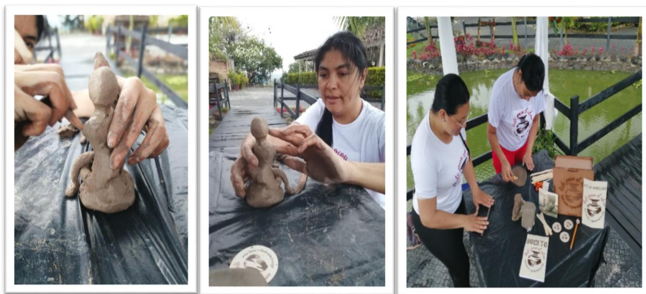
Figura humana.