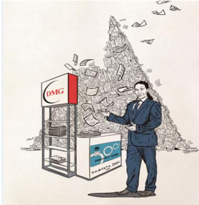
Ilustración: Juan Carlos Duarte

Otro de los casos más sonados fue el de Marco Antonio Gil alias el “Papero”, quien era reconocido por ser un empresario, en realidad era una fachada, pues era un confeso narcotraficante. Tenía vínculos con narcotraficantes extraditados a Estados Unidos de la talla de Francisco Ochoa, según las investigaciones realizadas por la Fiscalía, alias Papero participo en el proyecto “La Gorda”, el cual consistió en enviar desde Medellín a Houston 999 kilos de cocaína. Debido al fenómeno del narcotráfico la intervención de Estados Unidos se hizo cada vez más presente, porque afectaba directamente a su país al ser consumidor número uno de drogas.